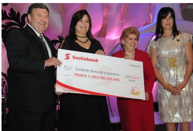
Donación a la Fundación Banco de la Esperanza