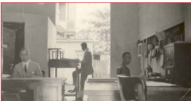
Sucursal San Pedro de Macorís

En los años 70 expandimos nuestras operaciones hacia la zona norte, abriendo sucursales en Santiago, Dajabón, San Francisco de Macorís, Bonao, Puerto Plata, entre otras ciudades. En los años 80 durante la crisis en el sector financiero, Scotiabank se mantuvo presente en el mercado dominicano, llegando a tener 14 sucursales con la apertura de una nueva oficina en San Francisco de Macorís.