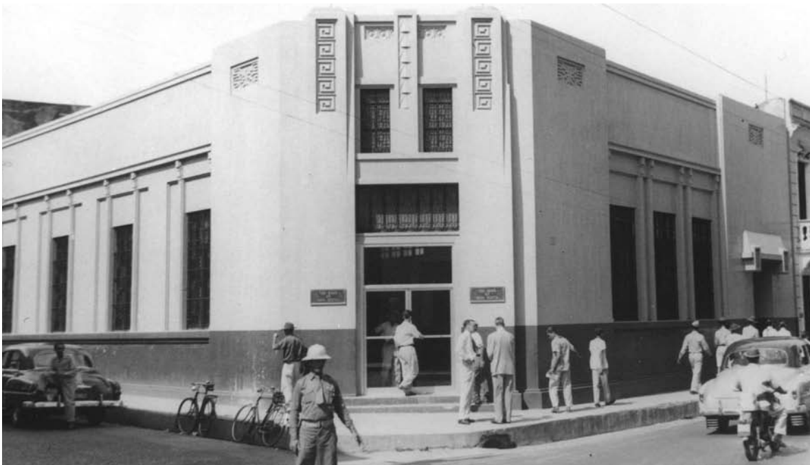
Sucursal Isabel La Católica