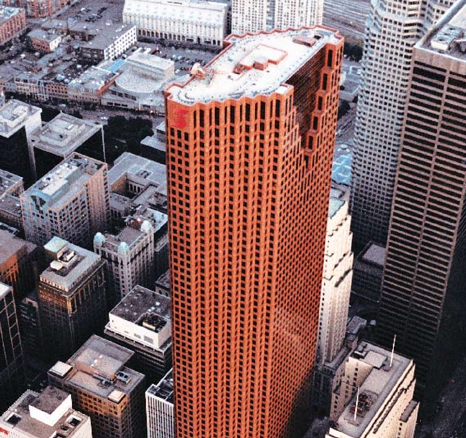
Scotiabank कॉर्पोरेट मुख्यालय, स्कॉटिया प्लाज़ा, टोरंटो