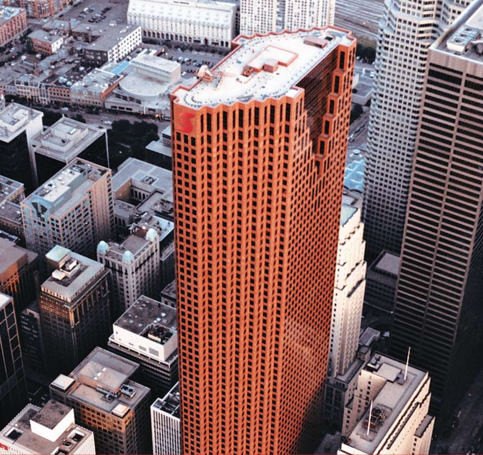
Scotiabank কপেরারেট প্রধান কাযরালয়, স্কটিয়া প্লাজা, টরন্টো