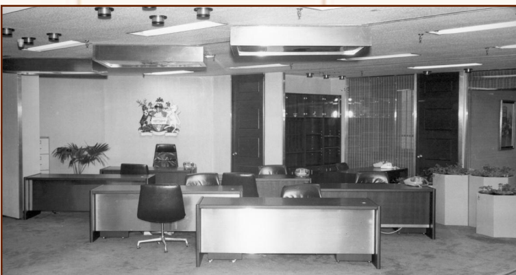
La Banque Scotia a été la première banque canadienne à ouvrir une succursale en Corée, le 6 mars 1978. ~ La succursale de Séoul en juillet 1978 ~