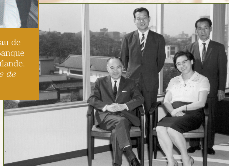
La première implantation de la Banque Scotia en Asie a été l'ouverture d'un bureau de représentation à Tokyo, le 25 juillet 1962. ~ Le personnel du bureau de Tokyo vers 1962-1964 ~