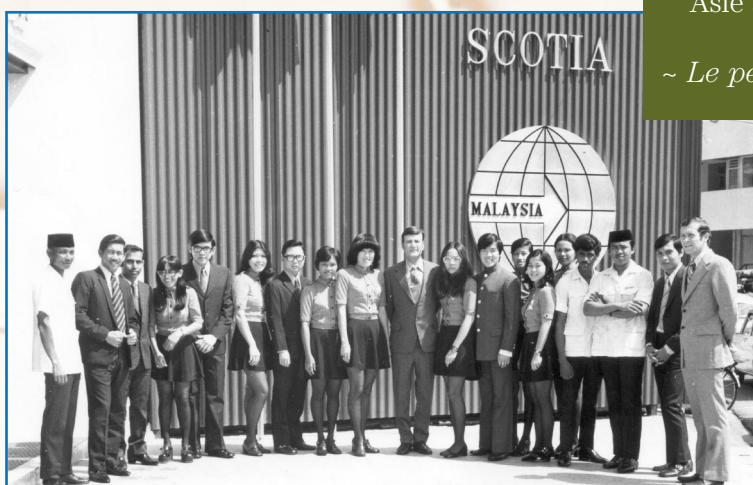
La Banque Scotia a ouvert sa première succursale malaise à Kuala Lumpur, le 26 mars 1973. ~ Le personnel de la succursale de Kuala Lumpur en 1973 ~