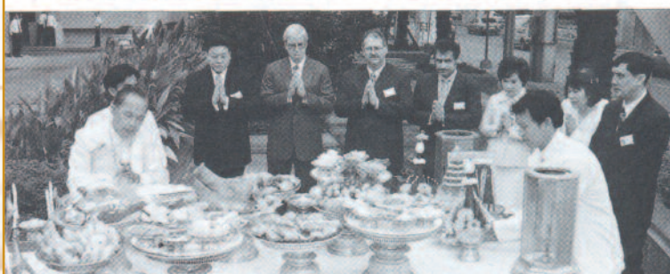
L'ouverture, le 1 er septembre 1980, d'un bureau de représentation à Bangkok, a marqué pour la Banque Scotia une présence de plus de 25 ans en Thaïlande. ~ Cérémonie d'ouverture de la succursale de Bangkok, le 2 juillet 1998 ~