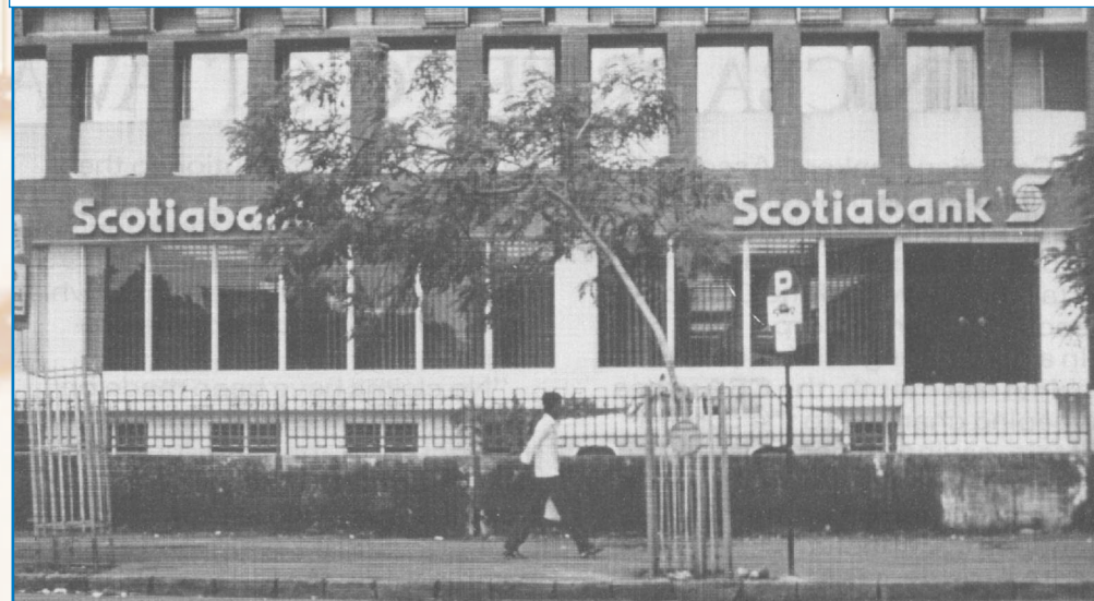
Le 2 septembre 1982, la Banque Scotia a ouvert un bureau de représentation à Bombay, aujourd'hui appelé Mumbai. ~ La succursale de Mumbai (Bombay) en mai 1984 ~