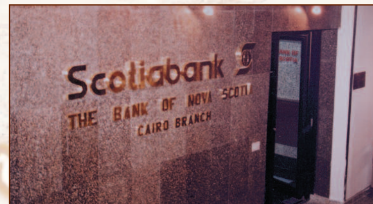
La première succursale de la Banque Scotia au Moyen-Orient a été ouverte le 8 novembre 1965, à Beyrouth. ~ La succursale du Caire dans les années 90 ~