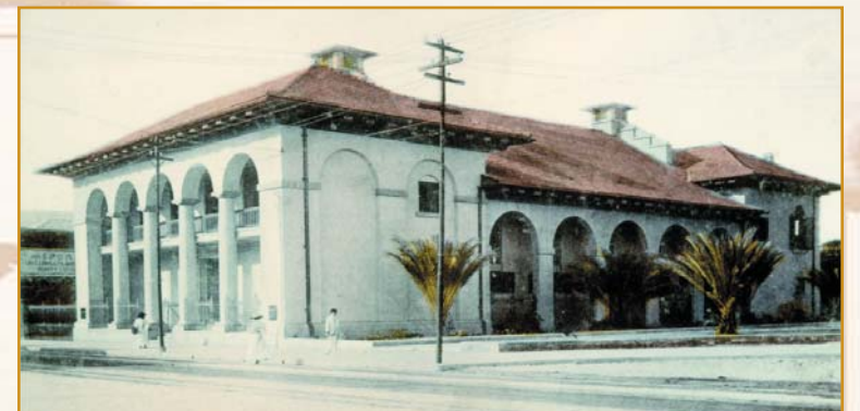
La Banque Scotia a été la première banque canadienne à ouvrir une succursale dans les Antilles, à Kingston (Jamaïque), le 24 août 1889. ~ La succursale de Kingston vers 1910 ~