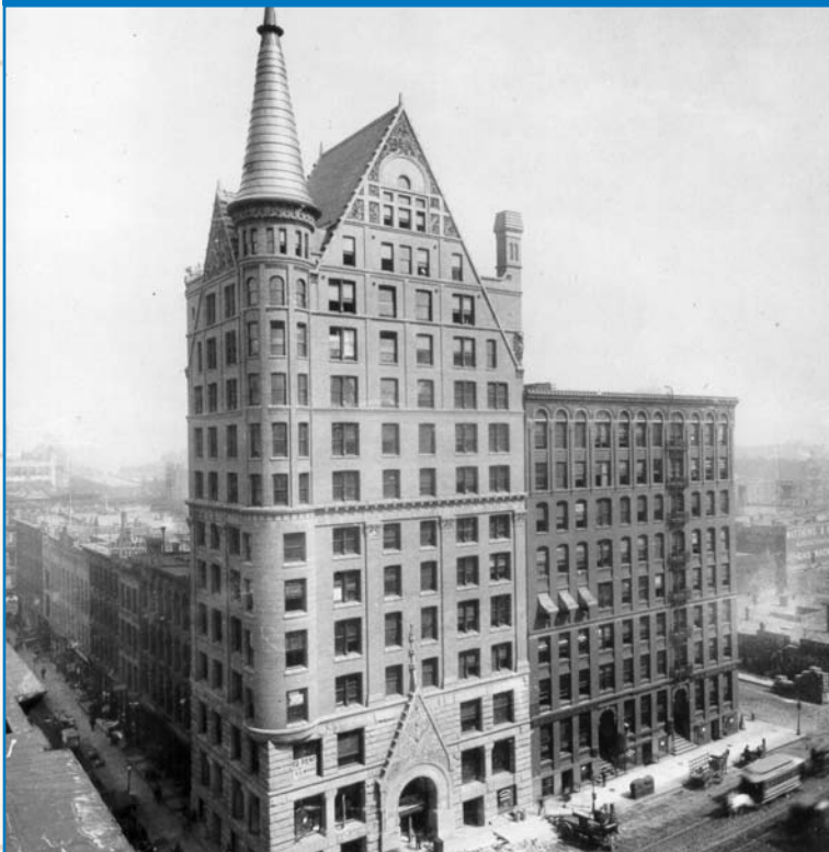
En 1885, la Banque Scotia entama son expansion hors du Canada avec l'ouverture d'une agence à Minneapolis (Minnesota). À sa fermeture, en septembre 1892, la Banque ouvrit l'agence de Chicago. ~ L'agence de Chicago (Illinois) vers 1900 ~