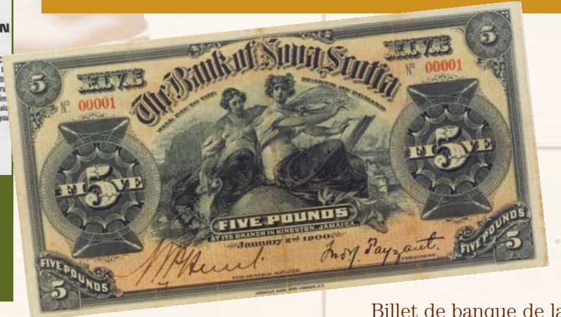
Billet de banque de la Bank of Nova Scotia Jamaica Limited, 1900.