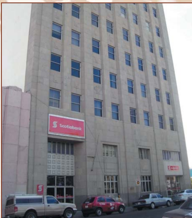
La Banque Scotia a fait sa première apparition au Mexique en 1967 avec l'ouverture d'un bureau de représentation à Mexico. En 1992, la Banque Scotia est devenue la première banque d'Amérique du Nord à investir dans une banque mexicaine, avec l'acquisition de 5 pour cent de Grupo Financiero Inverlat dont l'histoire remonte à 1934. ~ Principal Chihuahua (succursale principale), Chihuahua en 2006 ~