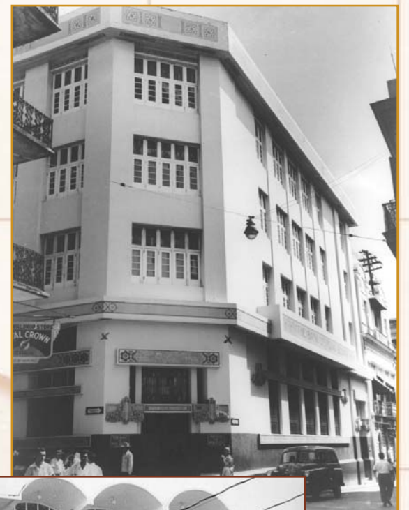
Le 14 novembre 1910, la Banque Scotia a ouvert sa première succursale à San Juan (Puerto Rico). ~ La succursale de San Juan en 1954 ~