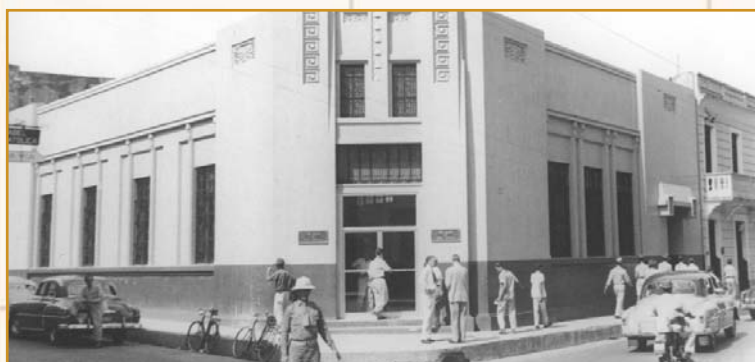
Seule banque canadienne présente en République Dominicaine, la Banque Scotia a ouvert sa première succursale à Saint-Domingue, le 1 er juillet 1920. ~ La succursale de Saint-Domingue en 1953 ~