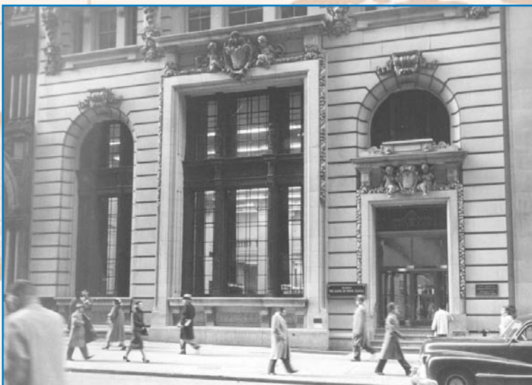
Le 23 mai 1907, la Banque Scotia ouvrait sa quatrième agence à New York. ~ 37 Wall Street, New York, 1953 ~