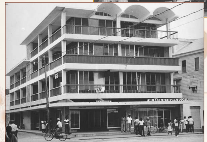
La Banque Scotia a ouvert sa première succursale en Amérique centrale à Belize City, le 10 décembre 1968. ~ La succursale de Belize City en 1969 ~