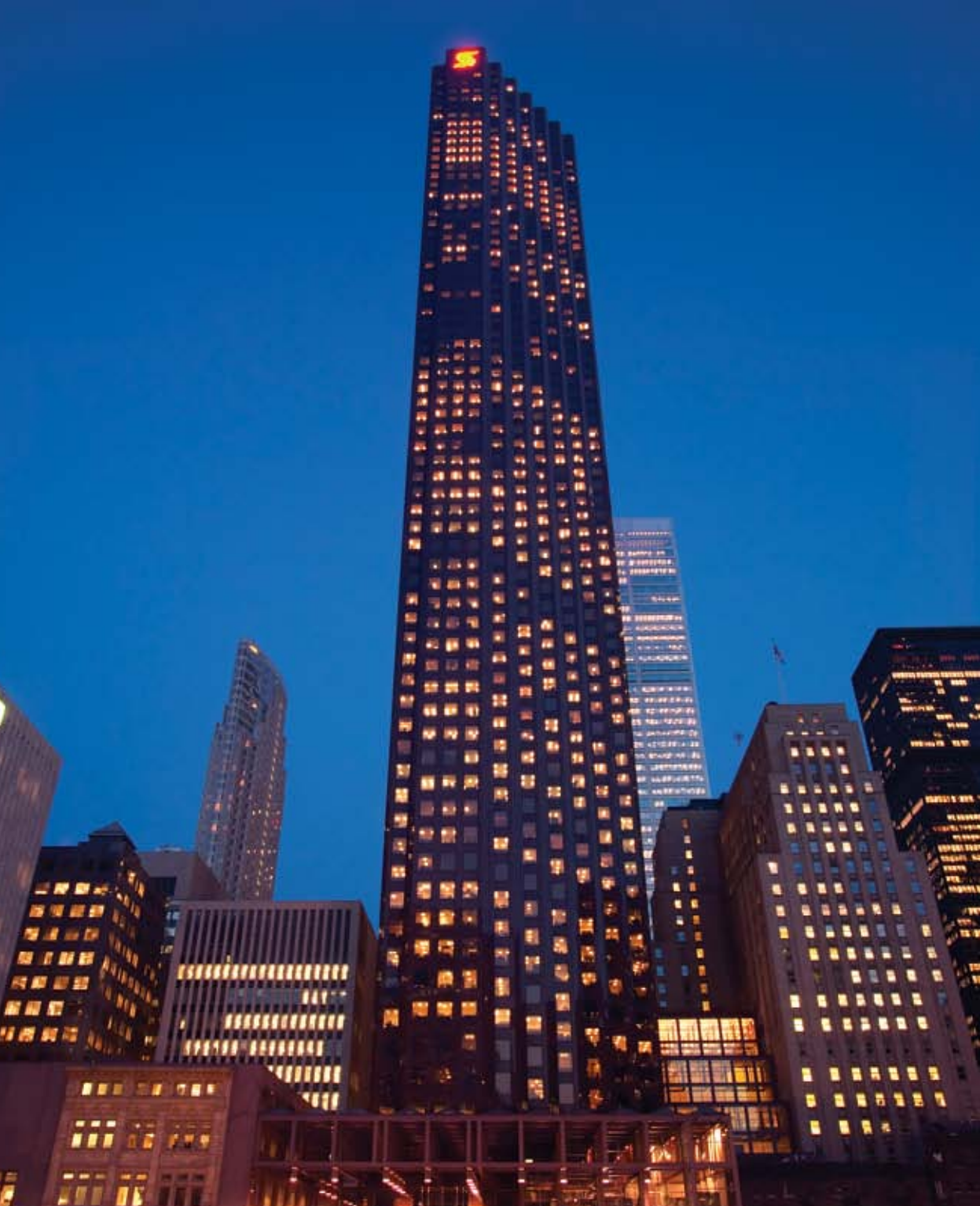
丰业银行集团总部，位于加拿大安大略省多伦多市的丰业广场