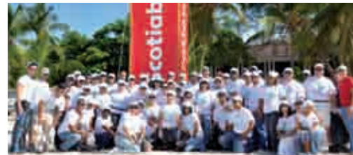
Empleados de Scotiabank durante la jornada de limpieza de costas en Boca Chica.

El Día Mundial de Limpieza de Costas, cerca de 400 voluntarios de Scotiabank participaron en la limpieza de 10 costas de distintos puntos del país entre ellas, Boca Chica, Nagua, Azua, La Romana, Moca, Samaná, Santiago y Las Terrenas.